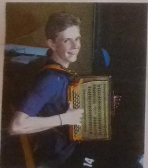
Koller Junior macht Musik. In Österreich gehört das einfach dazu.