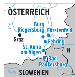
gute reise Infografik

Thermen- und Vulkanland www.thermenland.at Tel.: 00 43 / 33 85 / 66 0 40, das die Reise unterstützte. Anreise: Mit dem Auto ab Nürnberg gut 600 Kilometer. Mit der Bahn und Umstiegen mind. 9 Stunden. Günstig wohnen: Frühstückspension Raabtal www.pension-raabtal.at Tel.: 00 43 / 676 / 9 50 36 03 Luxuriös wohnen: